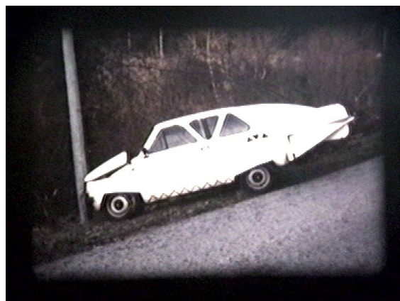
Aérofiat 2.1 - 1995 «The running gear and completed vehicule, shown during one of its very first outings», 1995