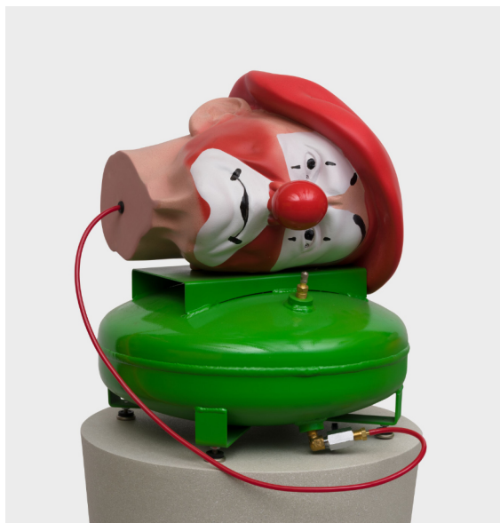
For Paris (Red) (détail)