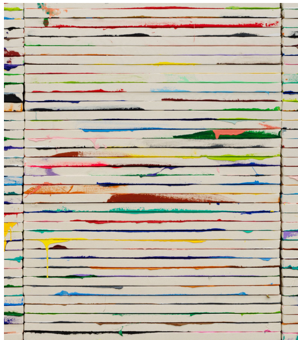
1000 Pictures (stacked paintings) (détail)