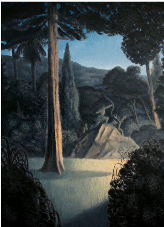
Iphigénie (projet de décor)