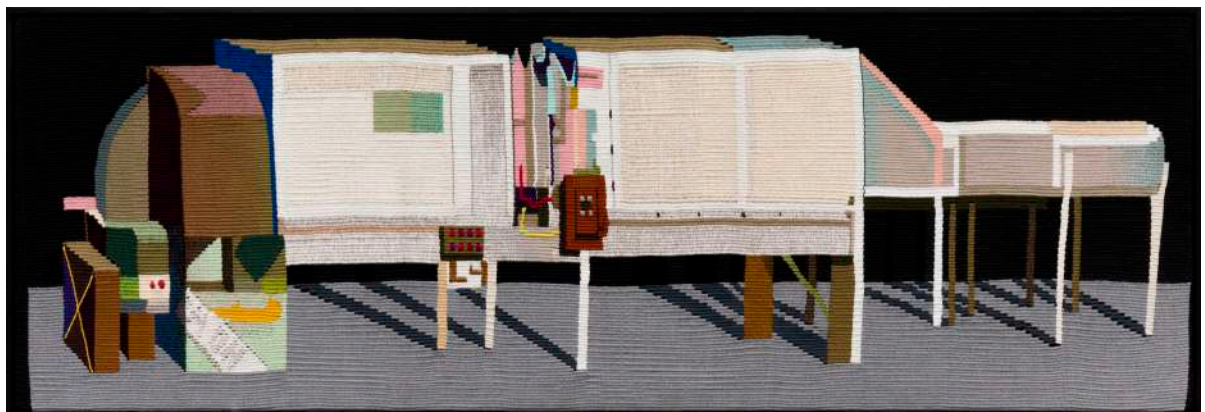
A Dog, 2021