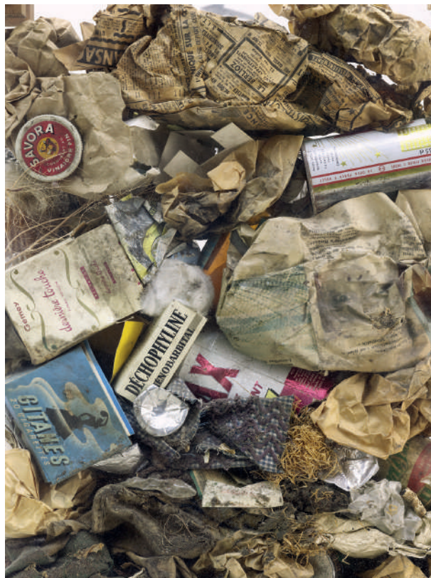
Arman, Déchets Bourgeois (détail), 1959

Les Nouveaux Réalistes trouvent une grande partie de la matière première qu'ils traitent/maltraitent aux Puces, dans les casses de voitures, les terrains vagues et le long des palissades censées masquer au regard les terrains vagues, voire dans les bazars et les Prisunic qui distribuent en masse des objets promis plutôt tôt que tard au rebut. Toutefois, leurs gestes n'avaient pas pour finalité de nier le réel.