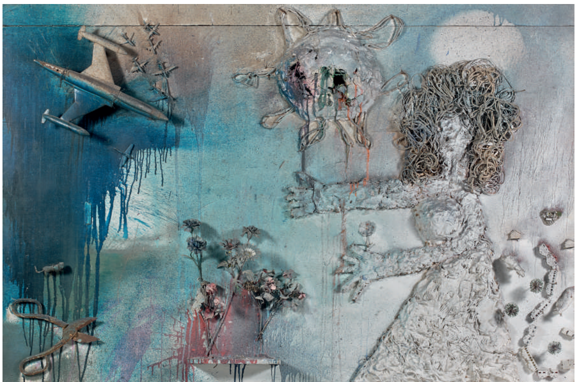
Niki de Saint Phalle, Tir Avion, 1961