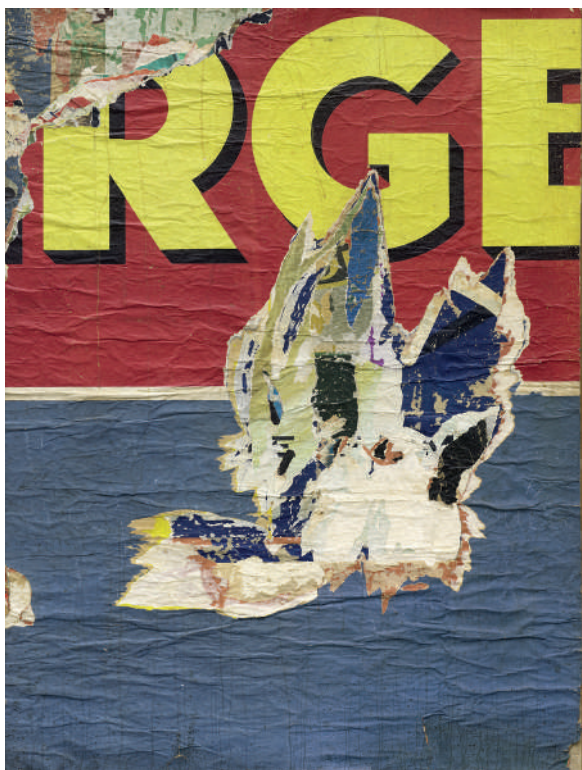
Jacques Villeglé, Avenue de l'observatoire, 1961

Extrait du texte de Catherine Millet pour le livre publié à l'occasion de cette exposition.