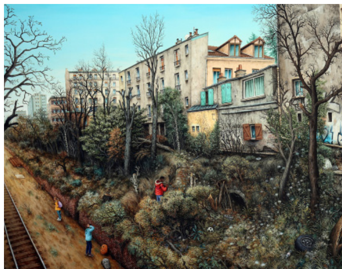
Julien Beneyton, Balle Perdue , (détail), 2020

Augustas Serapinas : « Notes d'Užupis » est une série d'œuvres, réalisées à partir de vitraux, qui examinent les professions en voie de disparition et les espaces obsolètes. Les œuvres réaniment le Vienkiemis disparu : des hangars agricoles à toit simple construits dans les années 1920 dans la Lituanie rurale, dont la plupart sont tombés en désuétude. Un monde à explorer que l'on devine ou imagine derrière les fenêtres aux vitres givrées rappelant les hivers glacés de sa Lituanie natale.