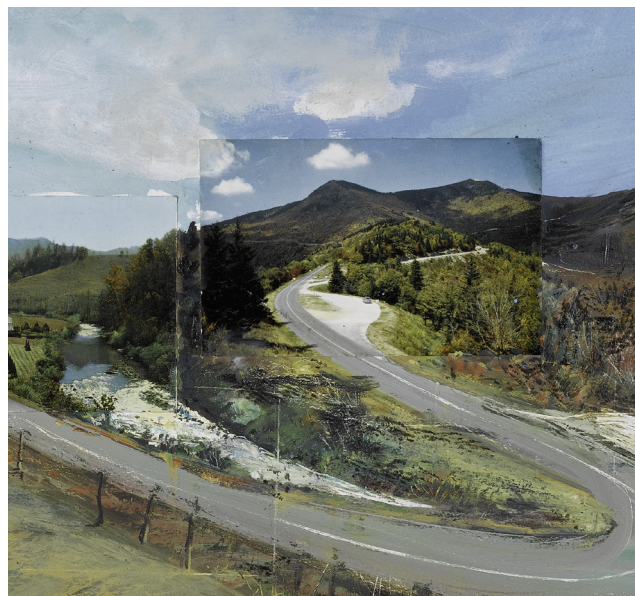
William Wegman, Road to Road , (détail), 2008

Jacques Villeglé , flâneur professionnel revendiqué, pérennise la lacération devenue création de l'anonyme de la rue. Villeglé a entamé sa promenade nourricière il y a près de 70 ans et est l'un des premiers promoteurs de l'aléatoire urbain. En tant que Nouveau Réaliste, il met véritablement en « œuvre » la définition officielle du mouvement : « Nouveau Réalisme = nouvelles approches perceptives du Réel ».