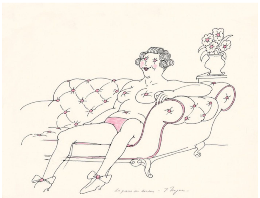
La guerre des boutons, 1970-1