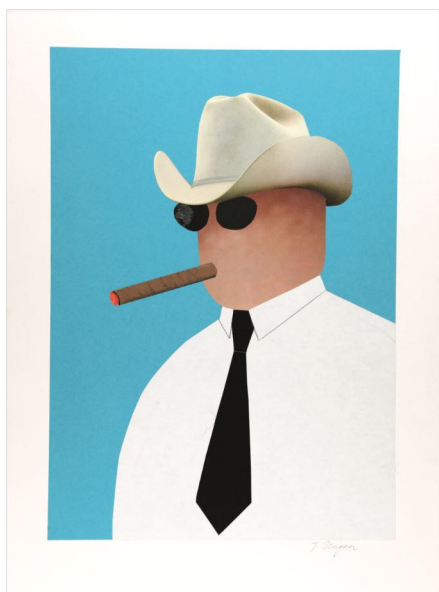
Sans titre, 2012