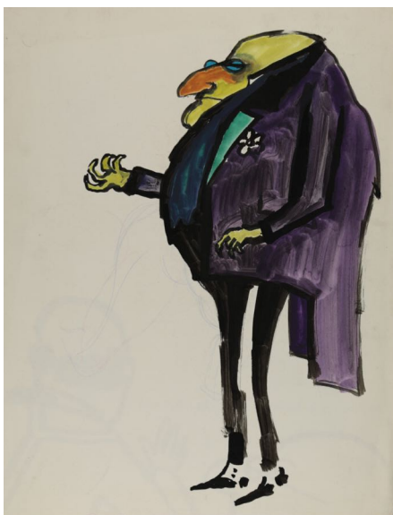
Sans titre (série « Les Sept péchés capitaux »), 1960