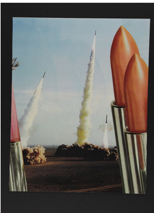
Sans titre, 2010