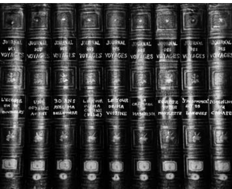
Journal des Voyages, série «La Bibliothèque», 2008

La Demeure du Grand Moghol, série «Le Gîte et le Couvert», 2008