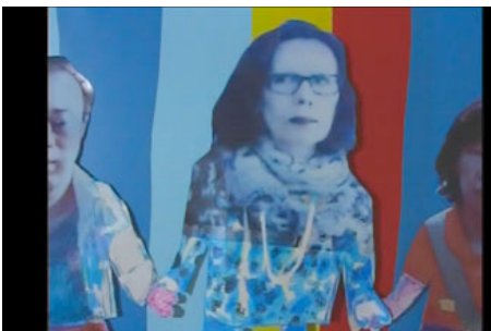
Small world, 2008