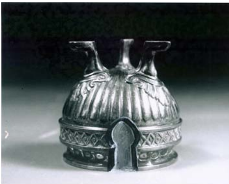
La demeure du Grand Moghol

La Demeure du Grand Moghol, série «Le Gîte et le Couvert», 2008