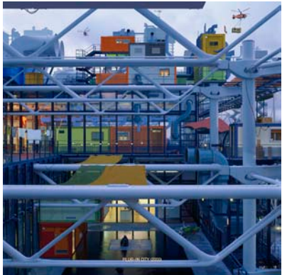
Alain Bublex, Plug-in City (2000) MNAM , 2009