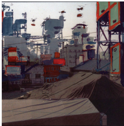
Alain Bublex Plug-in City (2000) - Séoul, Étude préparatoire, 2008

Sa pratique est quotidienne pour l'artiste: il converse le crayon à la main, illustre ses propos par un croquis, illustre les nappes en papier des restaurants et des carnets entiers. Chaque œuvre est précédée par une série de dessins préparatoires. Ce sont ces étapes préalables, indispensables, que nous avons décidé de mettre en avant pour Drawing Now ! On découvre ainsi que les grandes photos des séries Plug-in City (2000) sont conçues et composées à partir d'impressions basiques sur papier A4 des photos de fond rehaussées, au crayon, à l'encre, à la gouache, au blanco ; que les installations, interventions in situ et aménagements sont d'abord pensés sur des bouts de papier, des pages arrachées, parfois même le revers d'un courrier officiel !