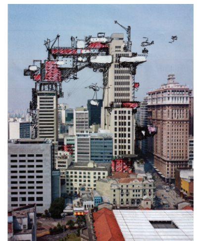
Alain Bublex Plug-in City (2000) - São Paulo 093, Étude préparatoire, 2015

Donner consistance au projet comme tel par l'invention de nouveaux formats qui non seulement évitent de le cantonner dans un moment précis (faisant se mêler les temps de la conception, de la production et de l'exposition), mais qui permettent également de maintenir en communication aussi longtemps que possible les pratiques les plus hétérogènes : du design à la photographie, en passant par la mécanique et le tourisme. Telle pourrait être une caractérisation du régime de travail d'Alain Bublex. Tour à tour urbaniste, expérimentateur et voyageur, l'artiste réinvente sans cesse l'idée de paysage, de ville, d'architecture ou de design. Le dessin tient une place discrète mais pourtant essentielle au sein de cette recherche.