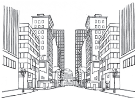
Julien Berthier, Mirrored street , 2012

le samedi 2 avril de 16h à 19h à la galerie