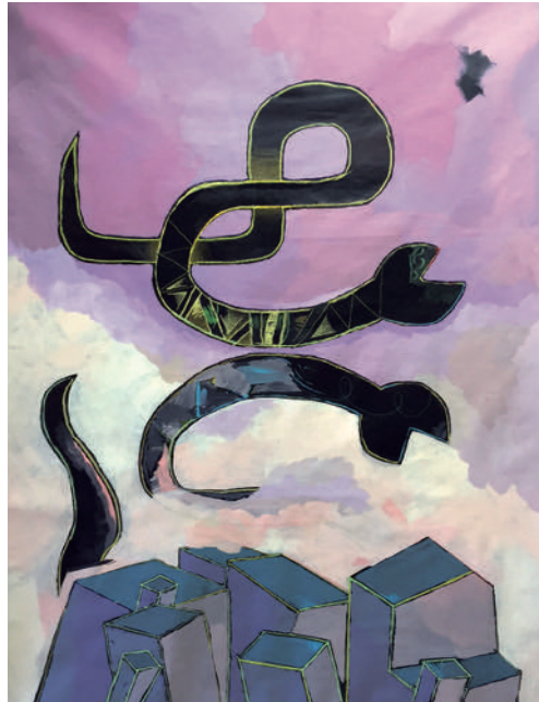
Adam Janes, As above so below , 2015