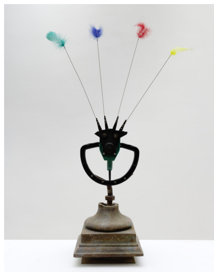
Hommage à Dada-Max, 1974

Au cours de sa carrière, l'œuvre expérimentale de Tinguely n'a cessé d'osciller entre vie et art. C'est dans cette optique qu'il crée une série de lampes en lien plus direct avec la vie réelle, animant l'espace public par le mouvement, la couleur et la lumière. Sophistiquées voire théâtrales, les lampes de Tinguely des années 70 empruntent leur esthétique à ses premières petites sculptures-machines, combinant une variété de pièces métalliques avec des ampoules colorées. Lampe Théière (1972), par exemple, imite la forme d'une branche d'arbre transformée en lampadaire. La structure métallique devient le support d'une combinaison éclectique d'objets absurdes, parmi lesquels une théière, des plumes, un abat-jour en métal blanc. Les sept ampoules de différentes couleurs au sommet de l'œuvre offrent un éclairage arc-en-ciel. Une œuvre joyeuse et chromatique, représentative de l'humour, de l'espièglerie subversive et de l'énergie électrique de cet artiste radicalement inventif.