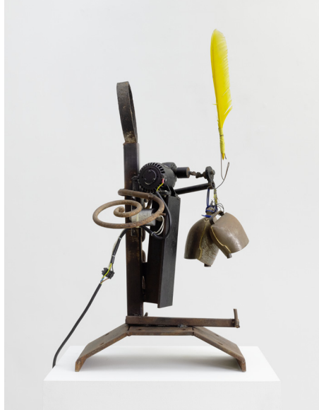
Sans titre (Les Cloches), 1974