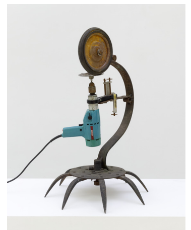
Sans titre (Briquolage), 1974

Throughout his career, Tinguely's experimental work oscillates between life and art. In this perspective Tinguely creates a series of lamps more directly related to real life, animating the public space by movement, color and light. Sophisticated or theatrical in their presentation, Tinguely's lamps from the 70s borrowed their aesthetics from its first small sculptures-machines, combining a variety of metal parts with colored bulbs. Lampe Théière (1972), for example, imitates the shape of a tree branch transformed into a standing lamp. The metal structure becomes the support of an eclectic combination of absurd objects, including a teapot, feathers, a white metal shade. The seven bulbs of different colors at the top of the artwork offer rainbow-like lighting. A joyous and chromatic work, representative of the humor, the subversive mischievousness and the electric energy of this radically inventive artist.