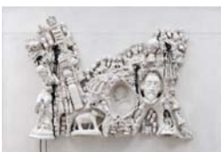
Niki de Saint Phalle

Enfin, « Le Château de Gilles de Rais », réalisé par Niki de Saint Phalle en 1962, est un tableau-tir particulièrement emblématique d'entrechocs. Celui d'abord du relief lui-même, rencontre entre un monde peuplé des reliquats de l'enfance et la figure criminelle, paternelle d'un « Barbe-Bleue » ; celui ensuite de l'action du tir à la carabine qui fait saigner à vif la peinture. Manipulant des objets trouvés et agencés en tableau-relief, elle confronte certains aspects de la vie réelle et intime avec une véritable exécution de la peinture, prise pour cible.