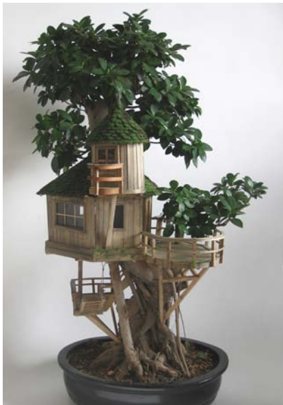
Gilles Barbier, La cabane, 2008