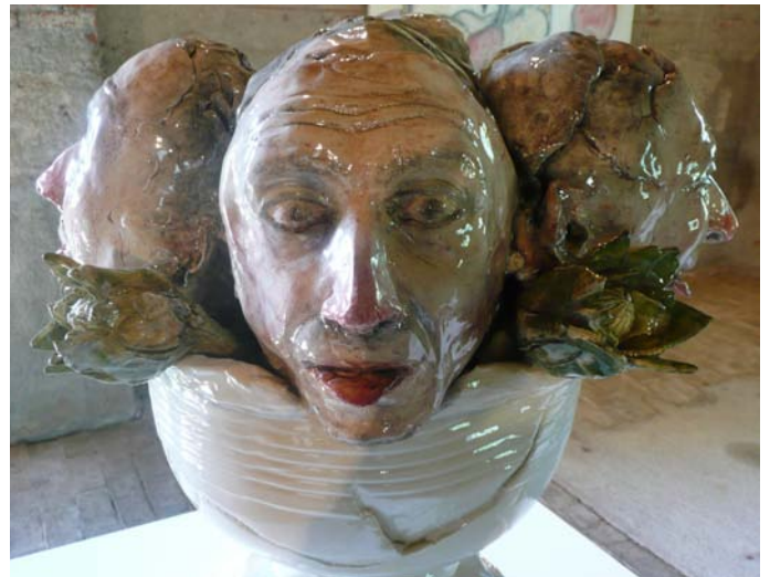
Saverio Lucariello, Sans titre , 2008