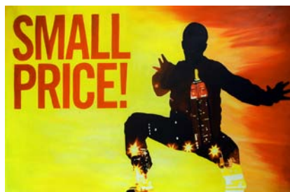
Mike Bouchet, Small Price!, 2008