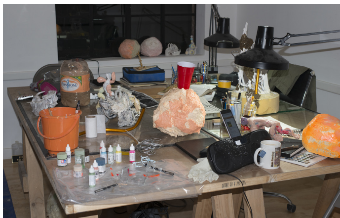
Vue de l'atelier

A travers sa perspective post-humaniste, l'artiste adopte la posture d'autres formes de vie, ou bien d'une intelligence artificielle, ou encore d'un Simulateur Omnipotent. Dans ce nouvel univers, il n'y a ni politique, ni logique, ni bien ni mal, encore moins de l'art, mais seulement des matériaux et leur combinaison devient le seul langage universel. Ce point de vue place l'activité humaine sur le même plan que les insectes, la roche et les virus. Il nous faut quitter l'Humanité afin d'entrevoir ce que nous sommes en train d'infliger au monde. Seul un non-humain peut critiquer un humain. Alors peut-être serons-nous en mesure de comprendre.